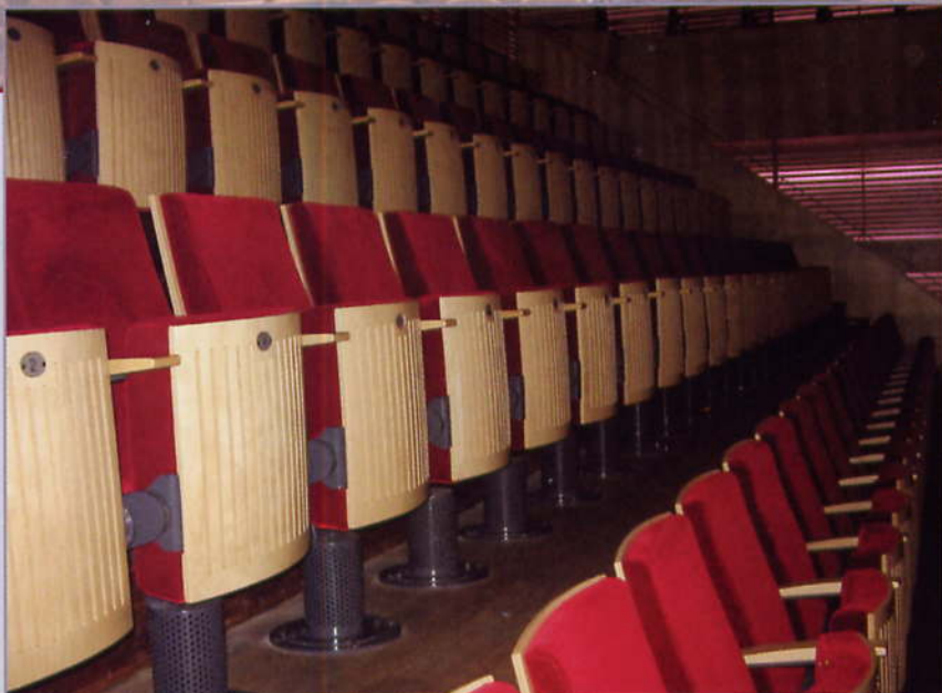
BIM theater Amsterdam. Peek bv.

Nederland is een bijzonder theaterland. De verschillen met andere Europese theaterlanden zijn groot. Met name het reizende karakter van de voorstellingen in Nederland komt in andere landen veel minder voor. De laatste jaren verandert er veel. Europa wordt steeds meer een eenheid, met als gevolg het ontstaan van Europese regels en richtlijnen.